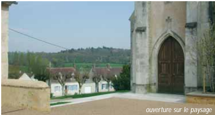
ouverture sur le paysage