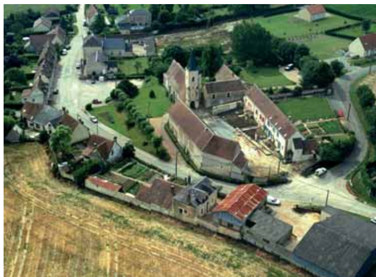
La cour de la Métairie en chantiers en 2001