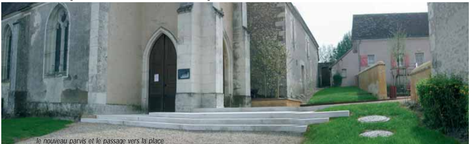
le nouveau parvis et le passage vers la place

N.B. Suite à cet aménagement de la Métairie, un nouvel audit d'aménagement a été lancé sur l'ensemble de la commune en 2005.