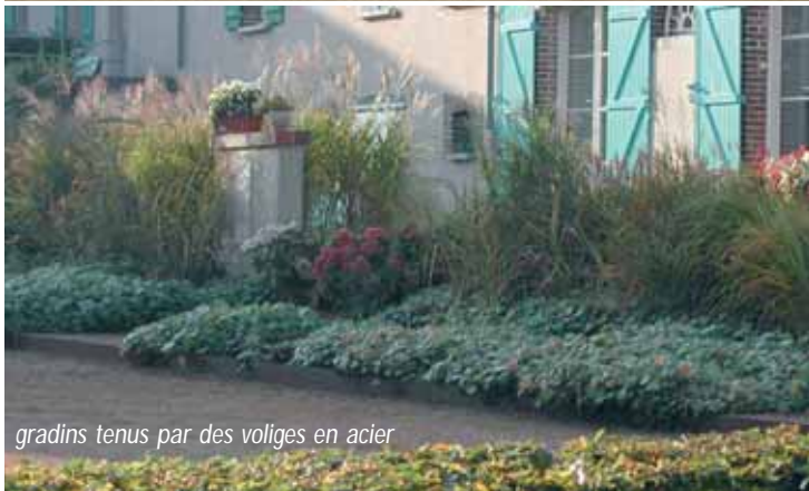
gradins tenus par des voliges en acier