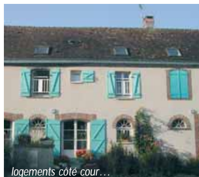
logements côté cour...