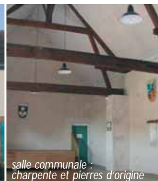
salle communale : charpente et pierres d'origine