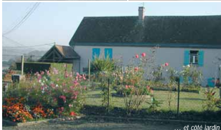
... et côté jardin