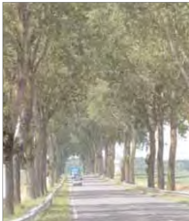
Vue rapprochée de la RD 605 : un bel alignement laissé en port libre ; la proximité des troncs par rapport à la route forme une voûte caractéristique