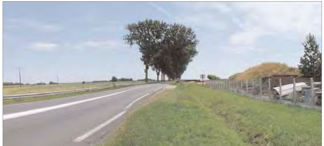
Vue de l'alignement de peupliers depuis la RD 605 : les flèches des peupliers d'une hauteur de 25 mètres constitue un repère dans le paysage