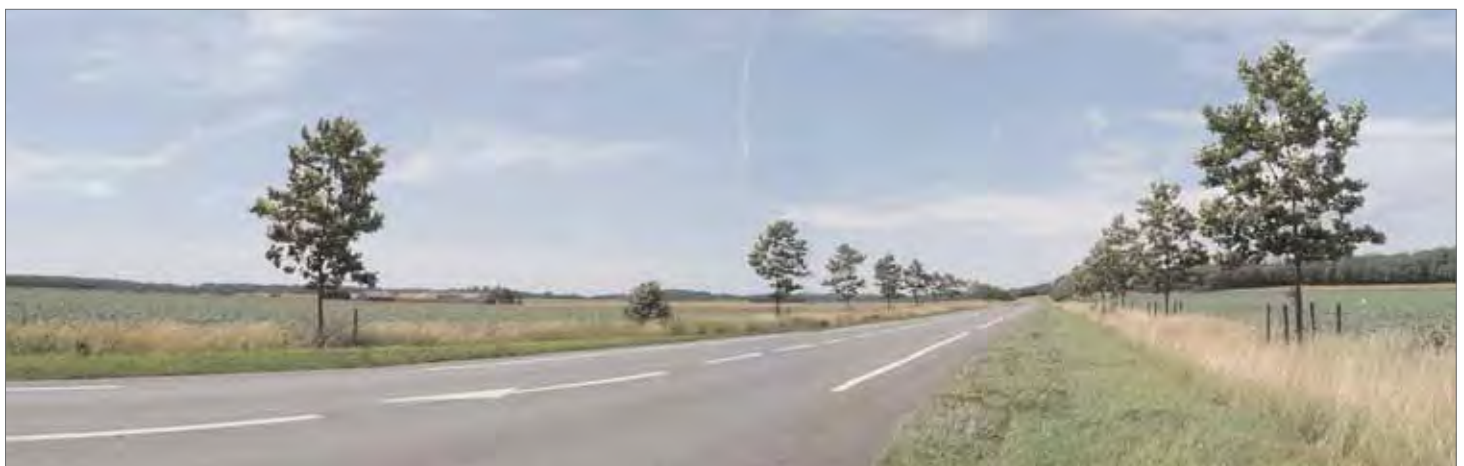
Vue d'ensemble de l'alignement de platanes sur la RD 408