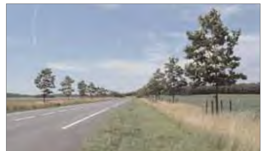
Vue d'ensemble de l'alignement de platanes sur la RD 408