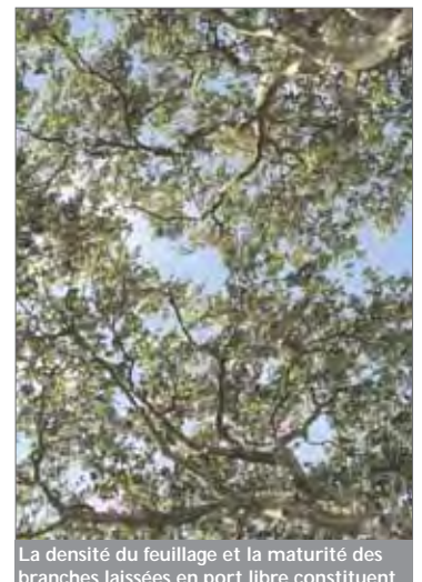
La densité du feuillage et la maturité des branches laissées en port libre constituent une voûte impressionnante