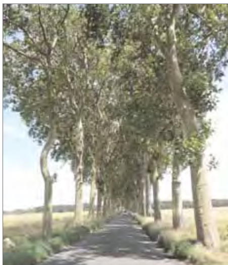
Vue générale de l'alignement de platanes sur la RD 215