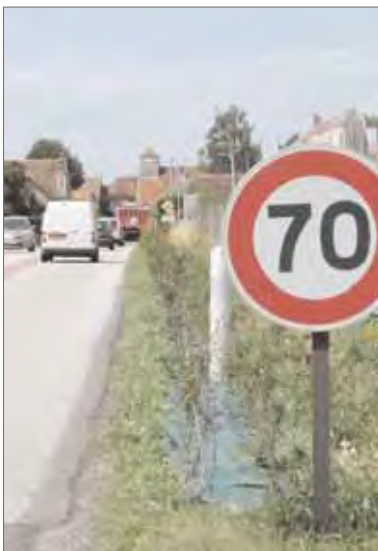
Vue rapprochée de l'aménagement sur la RD471