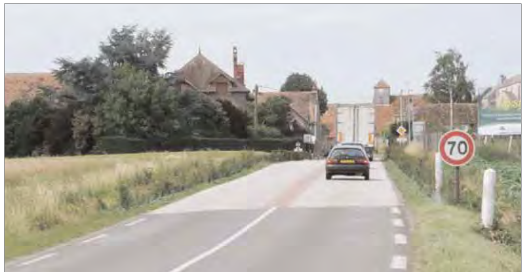
Vue générale de l'aménagement en entrée du bourg de Lissy : matériaux de chaussée spécifiques et plantations arbustives