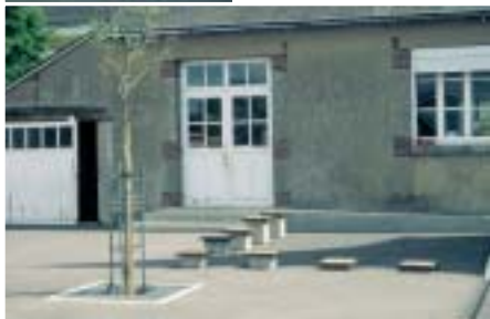
3 Les tabourets : jeu et repos pour les écoliers