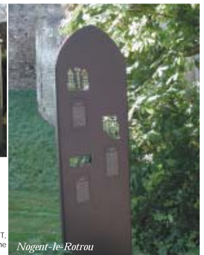
X. de RICHEMONT, scénographe

Abri-voyageurs aux parois vitrées s'intégrant bien dans son environnement végétal