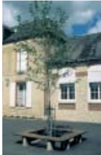
2 le coin des instituteurs : un banc en bois autour d'un arbre