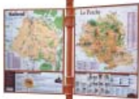
B. SAAS, architecte

Les deux Pays Perche ont souhaité se doter d'un mobilier d'information pour promouvoir l'image des communes par une signalisation adaptée à l'accueil des visiteurs de passage ou de séjour et destiné à affirmer l'identité du territoire du Grand Perche par la valorisation de ses ressources. L'idée s'est imposée de fabriquer des objets spécifiques. Une réflexion préalable sur leur implantation a permis de préciser la forme que l'on souhaitait leur donner. La pose sur les murs a été jugée préférable. Mais comme cela ne sera pas toujours possible, deux modèles ont été développés, l'un mural, l'autre sur pied. Des préconisations seront également données pour l'aménagement des abords. Les mobiliers sont en fonte et s'inspirent des panneaux indicateurs mis en place à la fin du XIX e siècle sur le département de l'Orne.