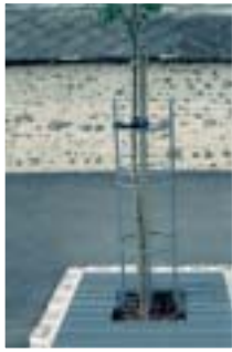
1 Traitement urbain pour les arbres : grilles d'arbres et corsets en acier