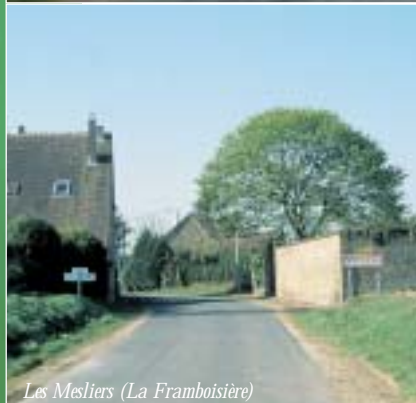
Les Mesliers (La Framboisière)

Lieux de transition entre l'espace cultivé et l'espace bâti, les entrées de bourg constituent des zones essentielles dans l'organisation du village.