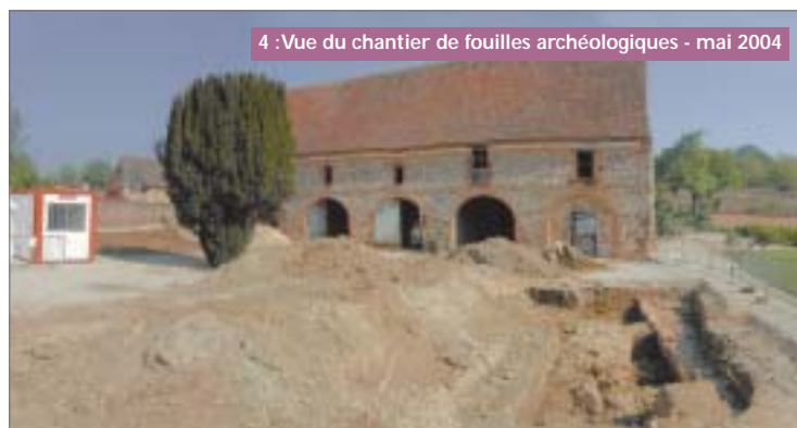
4 : Vue du chantier de fouilles archéologiques - mai 2004

FOUILLES ARCHÉOLOGIQUES : Les récentes fouilles menées par l'Institut National de Recherche Archéologique Préventive (I.N.R.A.P.) nous apprennent qu'elle était à l'origine en bois et daterait de la fin du XV ème s.