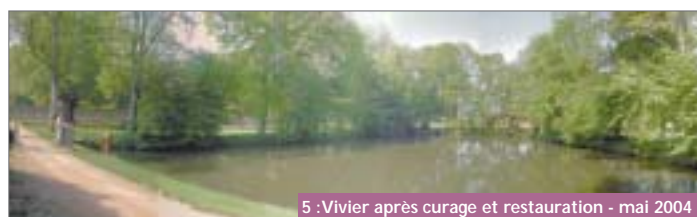
5 : Vivier après curage et restauration - mai 2004

1996 : le vivier est à l'abandon depuis des décennies, envahi par la vase et une végétation aquatique abondante.