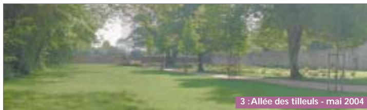
3 : Allée des tilleuls - mai 2004

assisté ponctuellement d'un stagiaire). De plus, elle mène le projet de renouvellement des plantes annuelles (légumes, fleurs...).